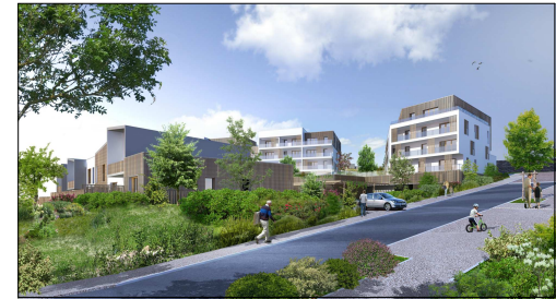
PLAN DE VENTE