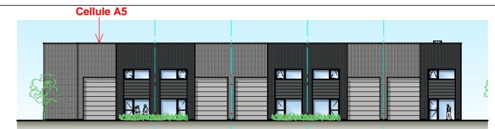
Façade NORD - EST