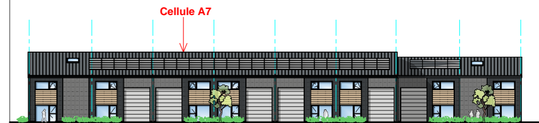
Façade NORD - EST