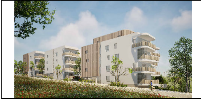
PLAN DE COMMERCIALISATION

4 impasse de Prémarié Queniquen 44 350 Guérande